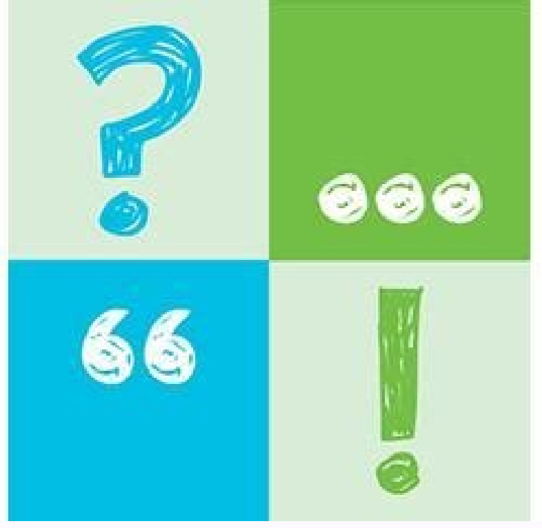
Examen planea 2016 contestado secundaria. Examen planea 2016 secundaria pdf. 2016 physics exam solutions.